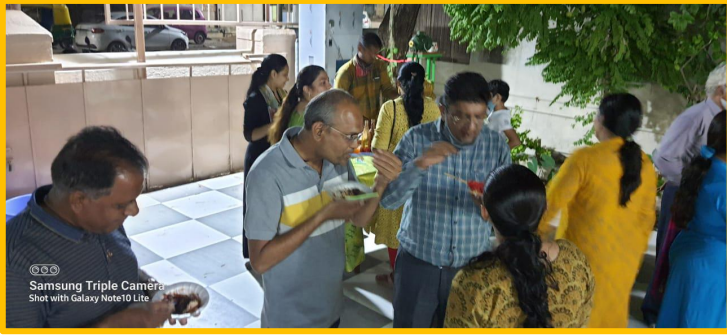
Samsung Triple Camera Shot with Galaxy Note10 Lite