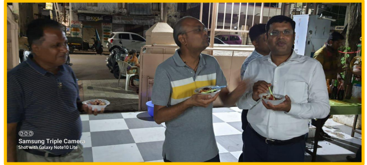
Samsung Triple Camera Shot with Galaxy Note10 Lite