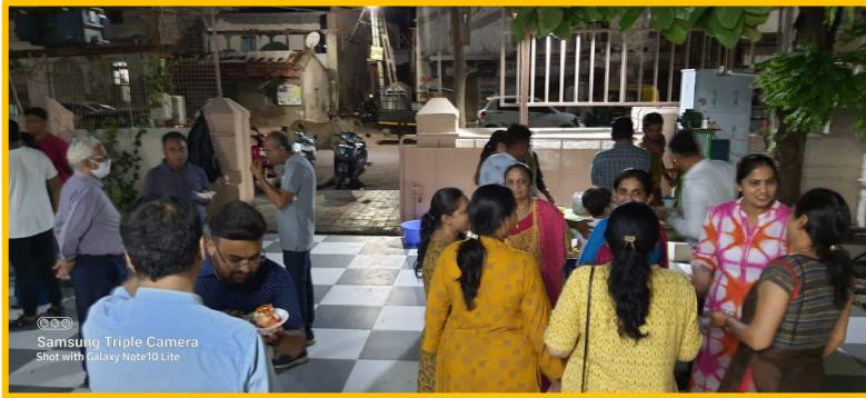
Samsung Triple Camera Shot with Galaxy Note10 Lite