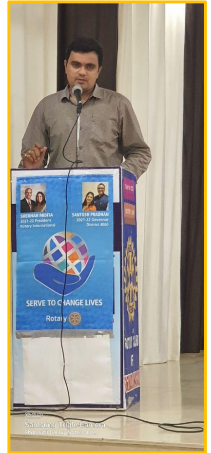
© Samsung Triple Camera Shot with Galaxy Note10 Lite