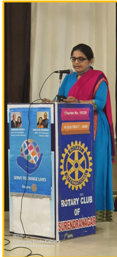
Samsung Triple Camera Shot with Galaxy Note10 Lite