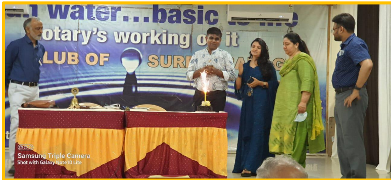
Samsung Triple Camera Shot with Galaxy Note10 Lite