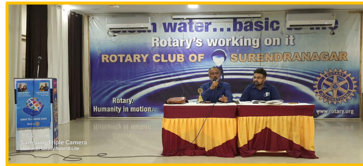
Samsung Triple Camera Shot with Galaxy Note10 Lite